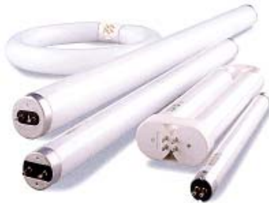
Abb. 1: Diverse Leuchtstoffröhren

Es gehört zum allgemeinen Erfahrungsgut, dass Insekten Lichtquellen umschwärmen. Nachtaktive Insekten fliegen jedwede Lichtquelle an, offene Flammen (Kerzen, Öl-, Gaslampen) ebenso wie elektrisches Licht.